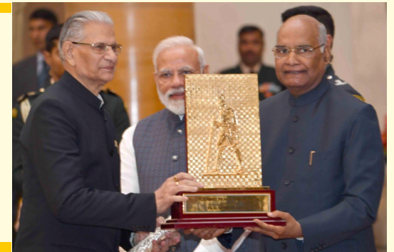
Gandhi Peace Prize 2017

We reached our ambitious goal of 102052 one teacher school, providing education to 2.7 + million underprivileged & marginalised children annually in the remote & tribal areas of our country.